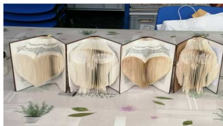
L'art du pliage

Et parce que l'entente cordiale existe chez nous, un jeudi après midi par mois, cartonnage et informatique se pratiquent dans la même salle.