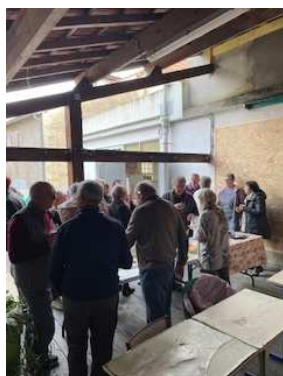
Apéritif à l'abri

À la fin du repas, le non moins traditionnel partage de la galette...avec ses rois et ses reines !