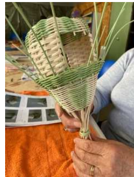
abri pour oiseau