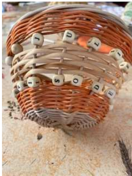
Quiz : que lisez-vous ?

Pour l'originalité de quelques créations !