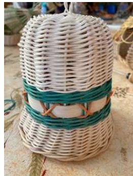
Une petite cloche