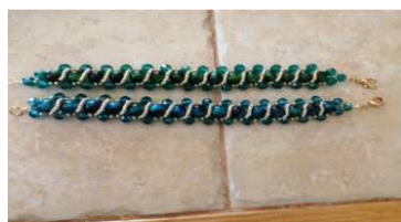
Modèle du jour : la gourmette.

1) Samedi 10 juin de 9h30 à 15h30 : Stage bijoux : 15€