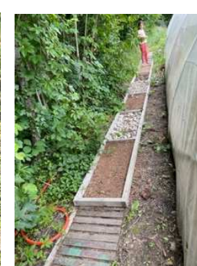
Passage secret des papillons