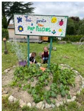
Jardin des papillons