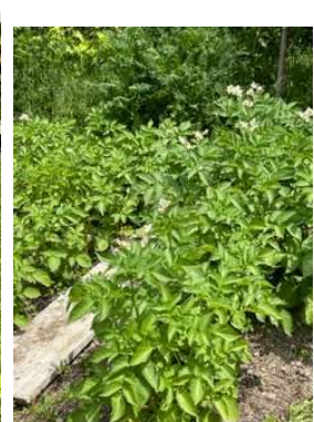
Pommes de terre